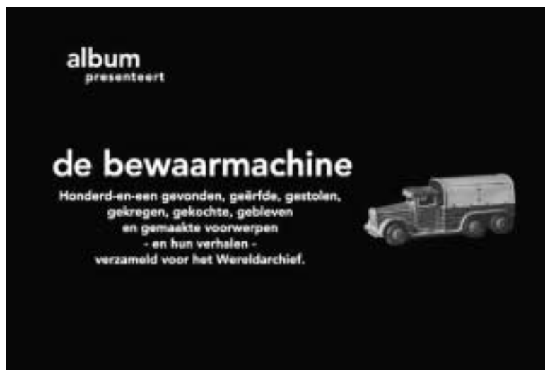
Afbeelding 5 Dick Tuinder e.a., De Bewaarmachine (1996).