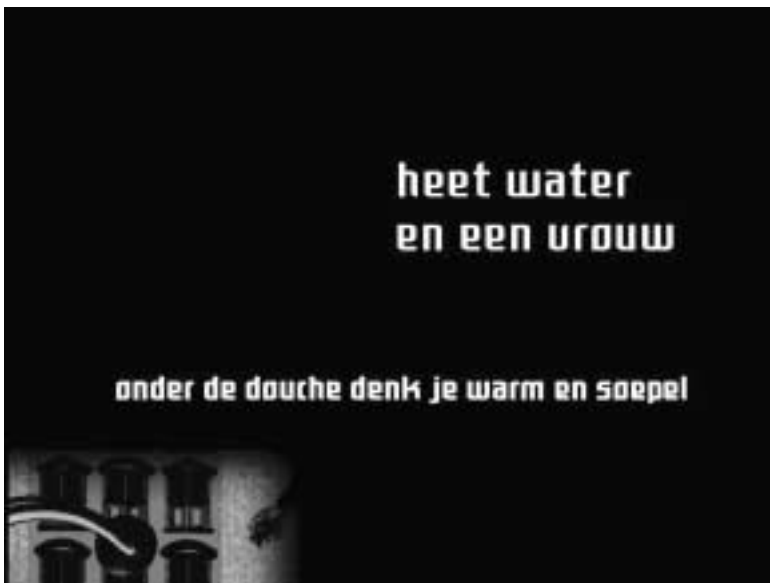
Afbeelding 3 Gert-Jan Van Schoonhoven e.a., Schaman gaat voor Goud (1995).