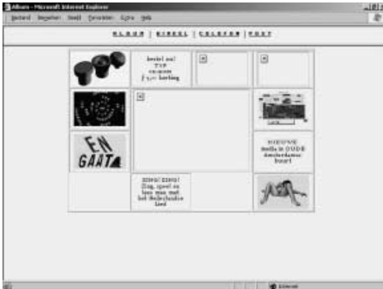
Afbeelding 2 Website uitgeverij Album.